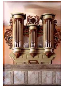
L'orgue Merkel Construit en 1747

Agrément ministériel national du 20 juin 2006