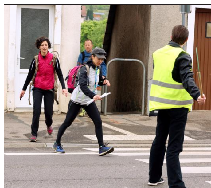
Parmi les 200 bénévoles, certains étaient affectés à la sécurité et devaient faire patienter les automobilistes. Pas toujours gagné !