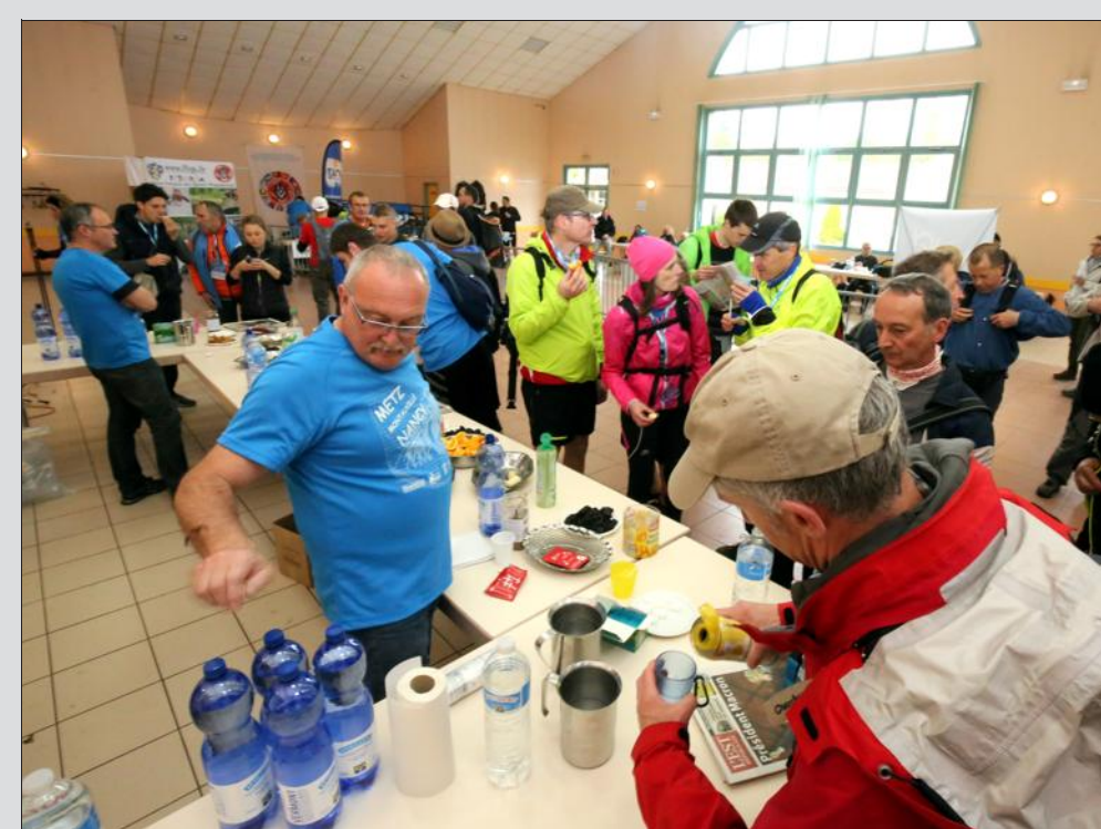
Le parcours comptait dix postes de ravitaillement dont celui, ici, de Montauville.