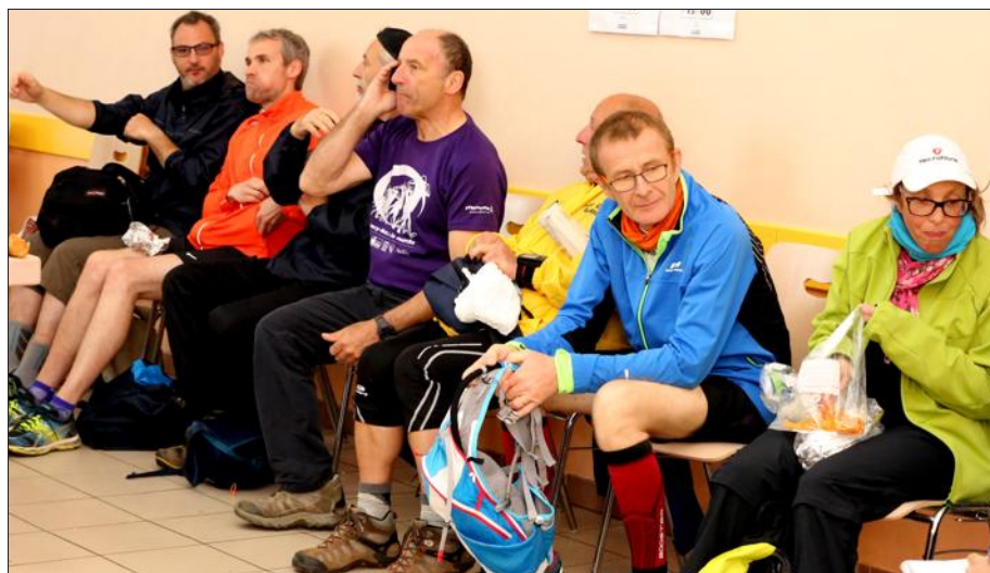
Pause dans la salle polyvalente de Montauville. Au-dessus des marcheurs, deux fiches indiquent les horaires de départ des navettes pour repartir à Augny ou se rendre à Nancy.