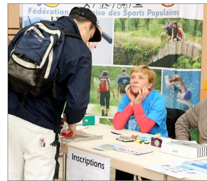
Trois cents personnes, peut-être préoccupées par la météo, se sont inscrites à la dernière minute.