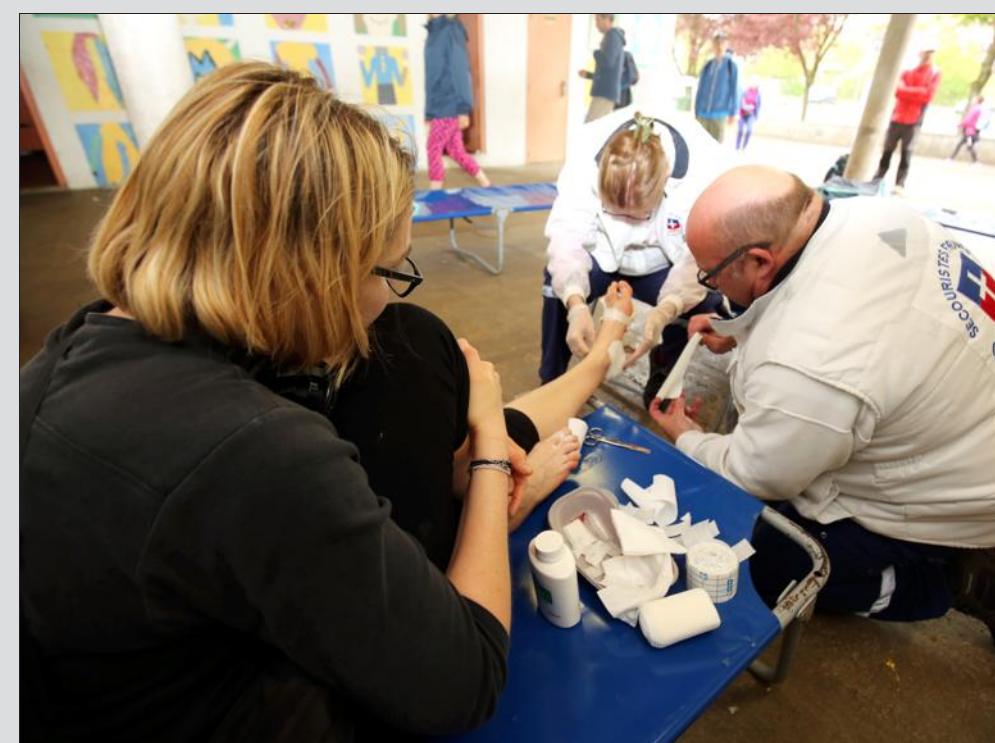
L'assistance médicale était assurée par l'Association des secouristes français Asam-Metz Croix Blanche avec un poste de soins complet.