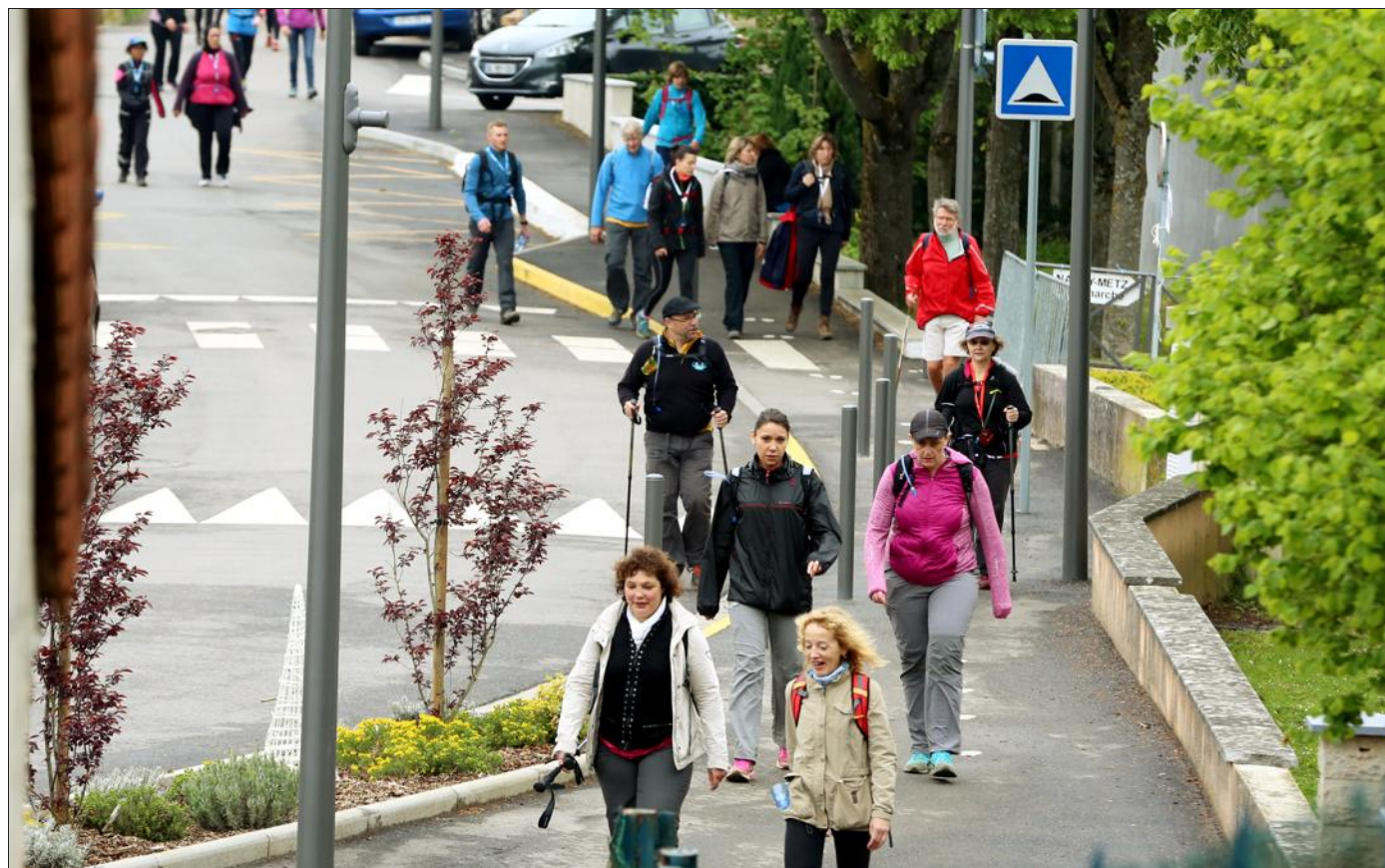
Pas de pluie mais un temps un peu humide pour cette 33 e édition.

Loin du record de sa 30 e édition, qui avait enregistré 2040 participants, la 33 e édition de la marche Metz-Nancy a toutefois rassemblé 1900 randonneurs. « C'est dû à la