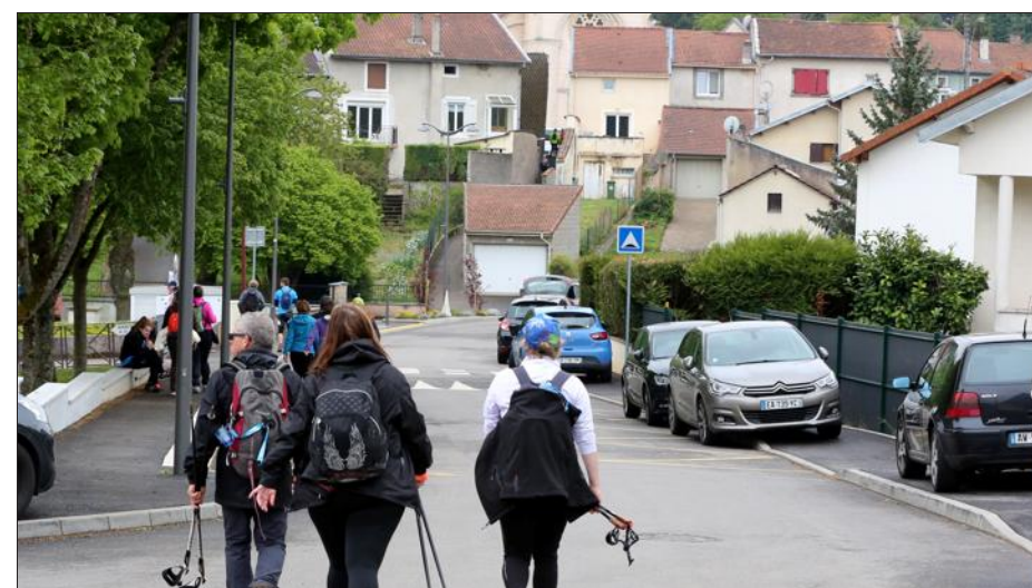
La prochaine édition se fera dans le sens Nancy-Metz. Par tradition, elle aura lieu le 8 mai 2018. Les randonneurs devraient se voir proposer un pôle de restauration à Montauville pour prendre un vrai repas.