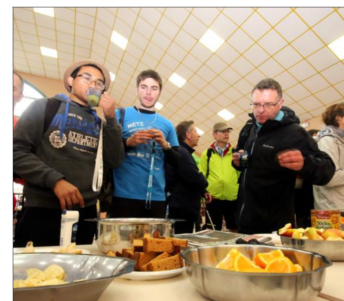
Du sucré, du salé, de quoi satisfaire les papilles et se recharger en énergie.